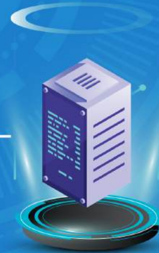
TRUNG TÂM DỮ LIỆU /DATA CENTER/