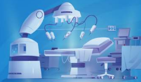
Y TẾ /MEDICAL/