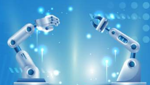
CÔNG NGHIỆP /INDUSTRY/