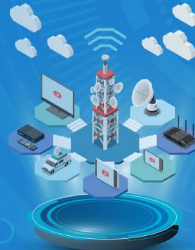
VIỄN THÔNG /TELECOMMUNICATIONS/